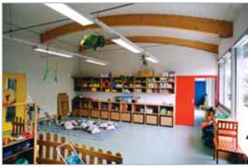
Espace enfant conçu en enfilade...