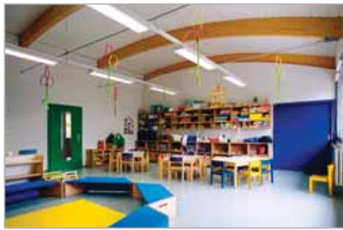
...avec portes de couleur et toiture arrondie