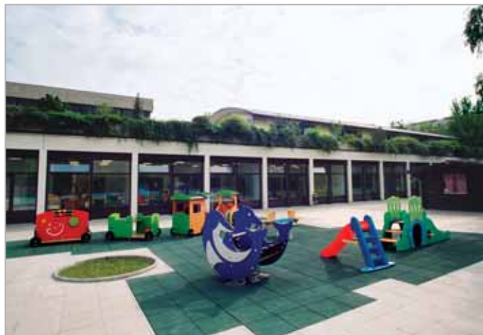
Jardin de plein-pied, côté Sud-Ouest

L'intervention a consisté à transformer la crèche existante et à l'agrandir, en disposant des surfaces initialement occupées par l'appartement du concierge et les dépôts de la voirie. Le déplacement de l'entrée principale dans le patio et la définition du couloir de distribution vers l'arrière du bâtiment, ▶