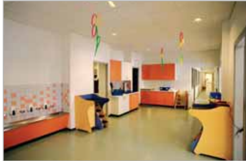
Espace de service et accès aux sanitaires

ont permis d'organiser les salles de vie des enfants (petits, moyens et bébés), vers la façade vitrée orientée au Sud-Ouest. Ces locaux bénéficient de la lumière naturelle et de la relation privilégiée avec le jardin.