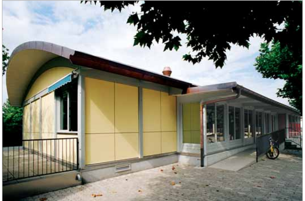
Entrée principale, pavillon modulaire en bois

Ingénieurs CVS Energiegestion SA Rue Alexandre-Gavard 28 1277 Carouge gotz@energiegestion.ch