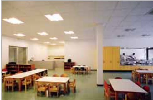
Réfectoire et cuisine au rez-inférieur